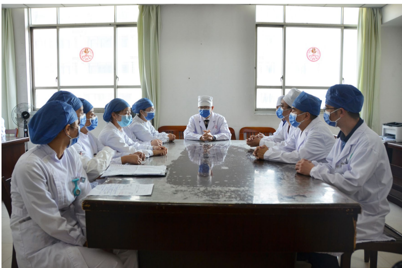
重症肝病科团队早交班